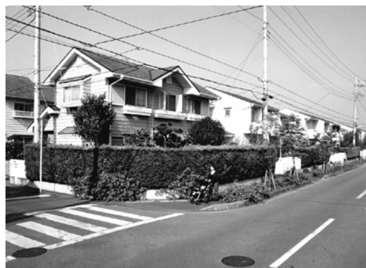
花田グリーンタウン