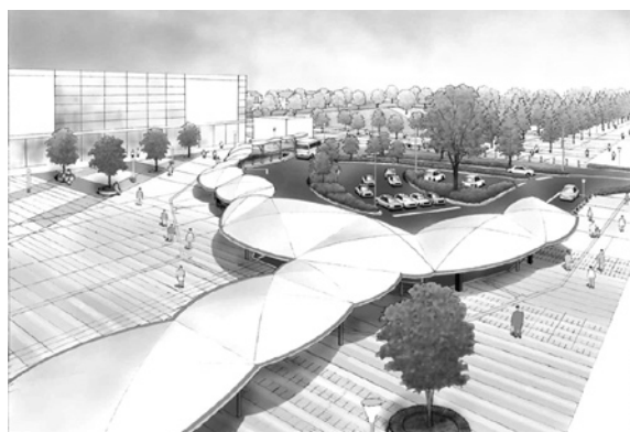
越谷レイクタウン駅・北口駅前ひろば完成予想図（提供：都市再生機構）

ひとかどの人は視点が違うと感心した覚えがあります。そこで日本の住宅は今後どうなるのかと聞いたところ、現状はコストが高いとのお話でした。日本はその労働集約型を脱