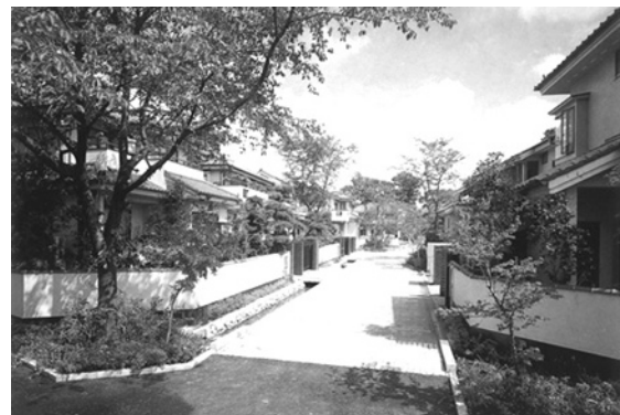
せんげん台・四季の路 (さいたま景観賞及び越谷市建築景観賞 受賞作品)

それには美しいと思う価値観を共有することが必要であり、例えば今の若い人に黙っていてもそれが伝わるかは疑問です。「美しさのコンセンサス」を一緒に考えていかなければ実現が難しいように思われます。