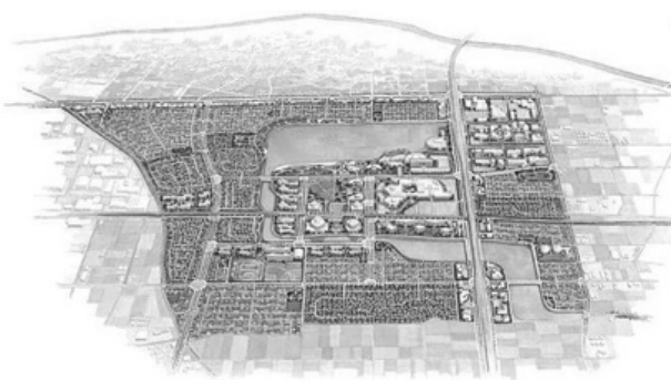
レイクタウン完成予想図

越谷市は来年度にレイクタウンのまち開きが予定されており、越谷駅東口再開発も動きが出てきました。これらを中心とした大型プロジェクトの景観について、市はどのように考えているのでしょうか？