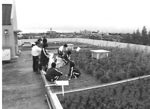
中央中学校の屋上緑化活動

越谷市での学習事例としては、小学校1・2年生では地域の人々や自然と触れ合う学習を行い、3・4年生で副読本「わたしたちの越谷」を活用して、市や県の土地の様子や人々の暮らし、まち