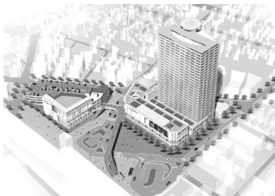
越谷駅東口再開発 完成予想図

また、越谷東口市街地再開発事業につきましては、文化のある質の高い中心核の形成を推進するため、市役所を中心とする行政機能に加え、便利で魅力のある商業・業務・